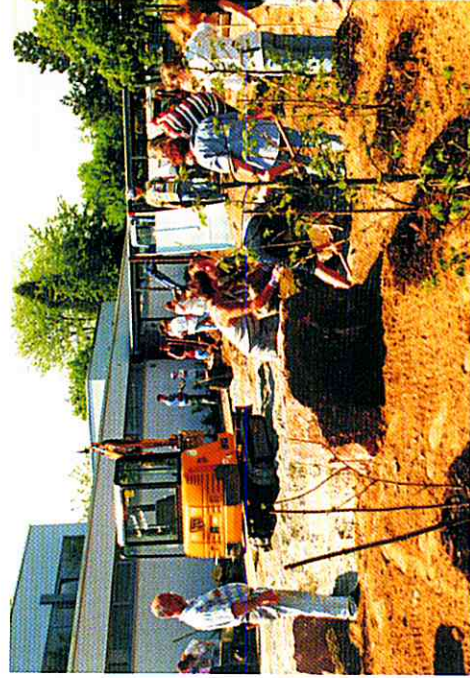
Gestaltung des Außengeländes aus Mitteln des Fördervereins - in der Bauphase 2003