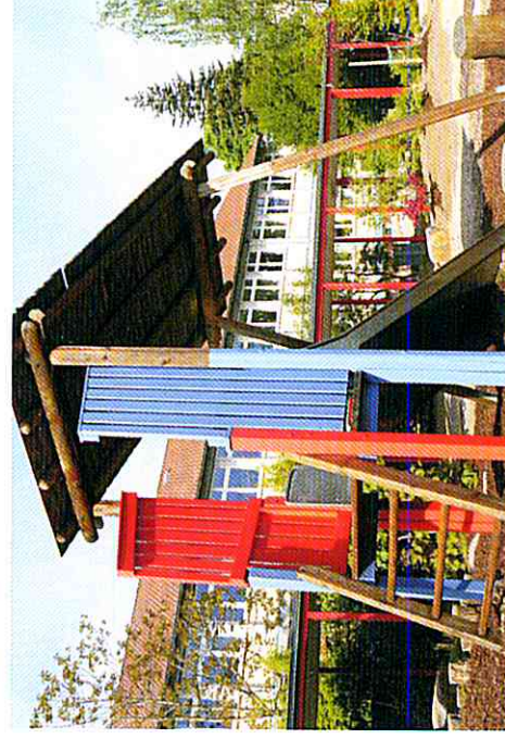
Rutsche - Teil des heutigen Spielplatzes auf dem Schulhof